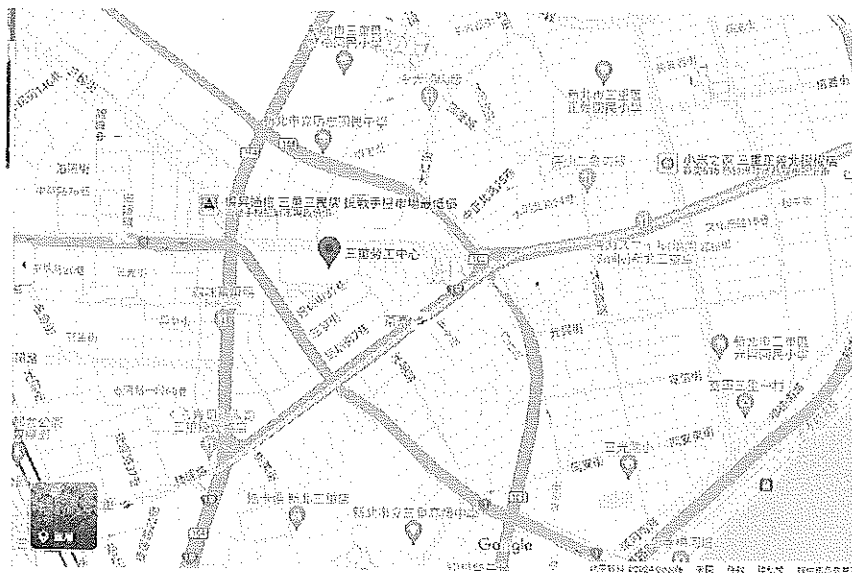
圖 1 新北市三重區勞工活動中心交通地圖